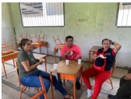
Zona de descanso y break Servidores Públicos Ecuador - Colombia