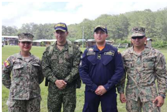
Coordinación Ecuador - Colombia