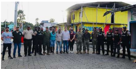
Reunión con Autoridades Locales