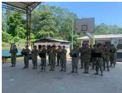
Banda Blanca - FFAA