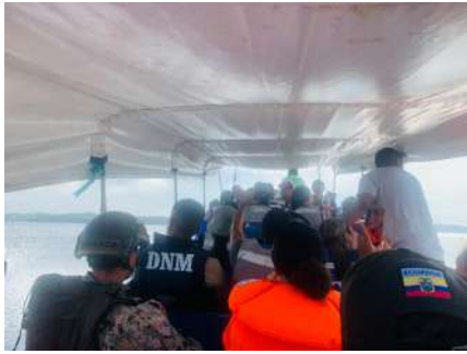
Traslado a Palma Real