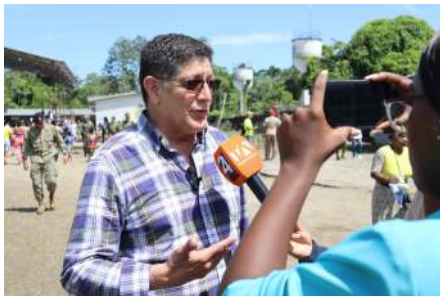
Atención a Medios