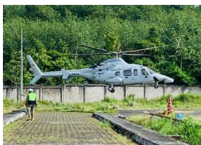
Llegada General Levoyer

Todo el personal civil y militar se trasladó a Palma Real, para revisar las última coordinaciones, la entrega de insumos, reunión con las autoridades locales y traslado de material, para este último se contó con el aporte de la Policía Nacional.