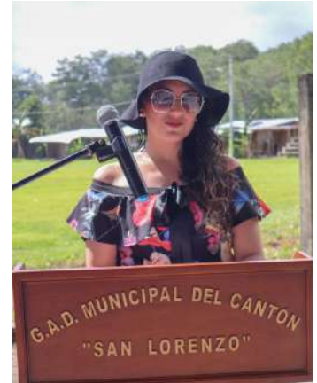
Maestra de Ceremonias