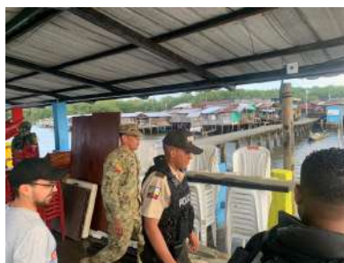
Traslado de Material