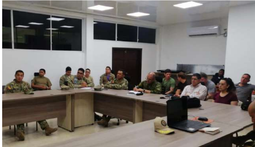
Reunión final de coordinación

Posteriormente se retorno al BIMLOR, para mantener la última reunión de coordinación, ubicación e ingreso de las autoridades y personal civil de las instituciones gubernamentales y no gubernamentales a Palma Real.