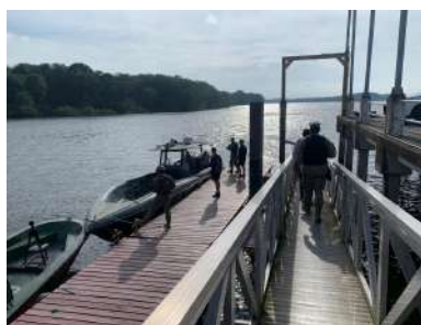
Traslado Palma Real