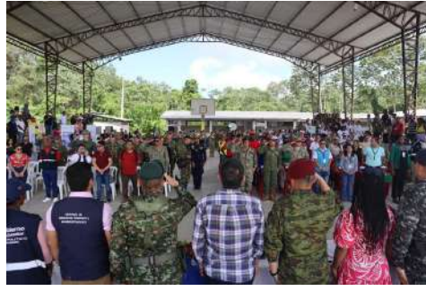
Acto de inauguración Palma Real